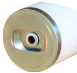
"ET" tapa superior