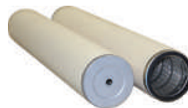
Cartuchos filtrantes con extremos abiertos y cerrados