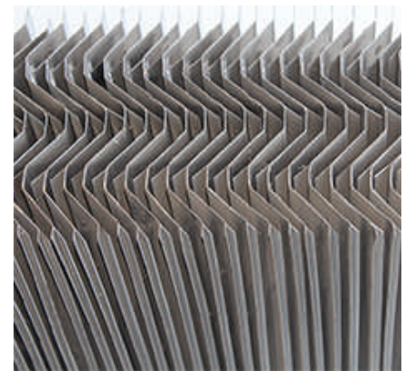
Sección típica de las vanes

Las especificaciones están sujetas a cambios sin previo aviso. 4-28-2020